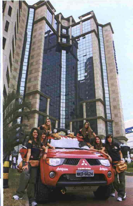
Foto grande: pick up e dune per le girls di Donnavventura. Da sinistra a destra: la carovana di auto, le nostre ragazze in azione, un chiringuito in spiaggia, i muli di Paraty, un villaggio di pescatori lungo il Rio delle Amazzoni. Qui sopra: il team al completo a San Paolo.

del viaggio (le ultime puntate stanno andando in onda la domenica alle 14). La prima tappa del nostro tour è San Paolo: 28 milioni di abitanti, di cui un terzo vive nelle favelas, a pochi passi dagli eleganti e sorvegliatissimi quartieri dei ricchi. Il traffico è più caotico che a New York, ma ovunque regna il tipico calore "paulista", che rende le persone sempre sorridenti e rilassate. Ognuna di noi è qui per vivere un sogno, ma anche per superare i propri limiti. Per sfidare la paura del buio, della fatica psichica e fisica, degli insetti, dell'ignoto... Il tempo di controllare i potenti pick up, con la stessa perizia dei meccanici della Ferrari, e puntiamo verso nord. In serata raggiungiamo Paraty. Un paesino dove il tempo sembra essersi fermato sui cornicioni colorati delle finestre e sui tetti delle case coloniali. E al posto delle auto "galoppiano" pittoreschi calessi trainati da muli.