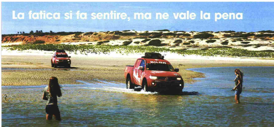
Sopra: i pick up guadagnano le lagune di Canoa Quebrada, vicino a Fortaleza, nel nord est del Brasile. La zona è poco turistica e quindi ancora incontaminata. Sotto: un pescatore mostra con orgoglio l'anaconda che ha appena catturato. A lato: le ragazze del team di Donnavventura.